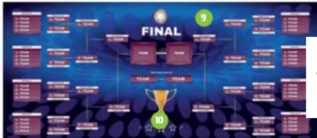
9. championship- mistrzostwa 10. winner- zwycięzca