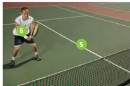
5. tennis court- kort tenisowy 6. player- gracz