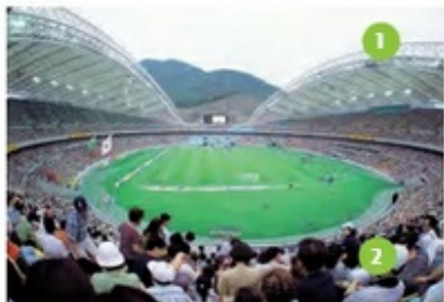
1. stadium- stadion 2. spectator- widz